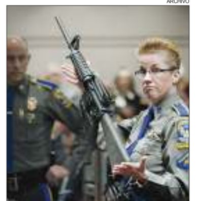
MATANZA. Veinte niños y seis adultos fueron asesinados en diciembre de 2012.

Por la venta de un fusil de asalto a un civil, la fabricante de armas más antigua del país suscribió un acuerdo por 73 millones de dólares con nueve familiares de fallecidos en la masacre de Sandy Hook