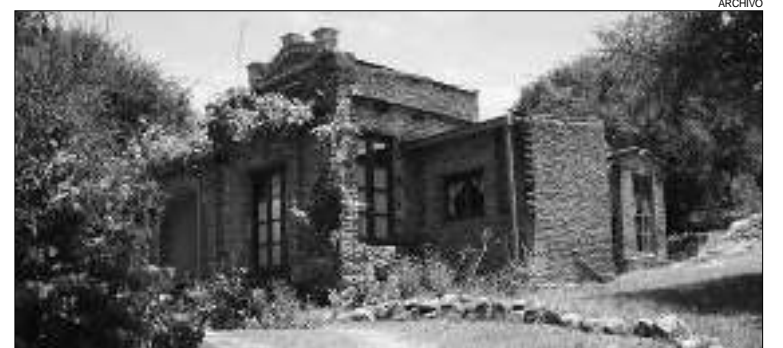
"Casa Museo Fernando Fader"

Anticorrupción. El gobernador de Entre Ríos, Gustavo Bordet, anunció que avanzará con la creación de la Fiscalía Anticorrupción, que funcionará en el ámbito del Ministerio Público Fiscal. Esa Provincia ya se encuentra trabajando en el proyecto de ley que crea el organismo para así dar cumplimiento a una manda la Constitución, desde 2008.