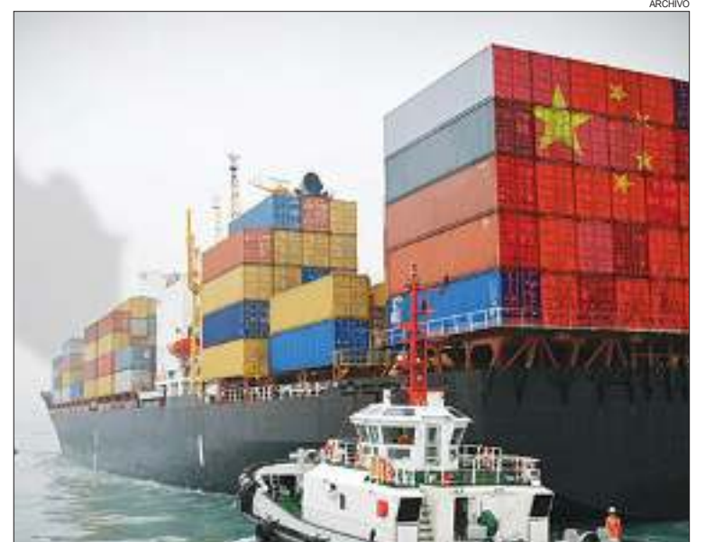
EXITOSAS. Las pequeñas y medianas empresas argentinas que exportan a China.