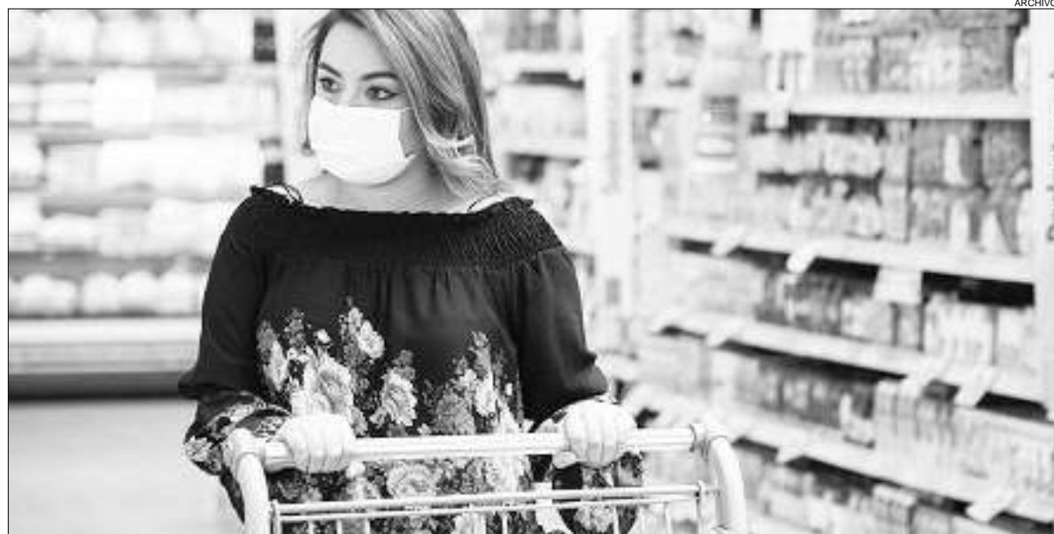
AUMENTO. El consumo masivo creció 2,5% en enero por el impulso del turismo interno.

El programa PreViaje y la recuperación del turismo interno revertieron meses de caída en el gasto. Lideran el alza los comercios de pequeño y mediano formato, de hasta 500 metros cuadrados. La facturación comercial de enero fue 56% superior a la de un año antes