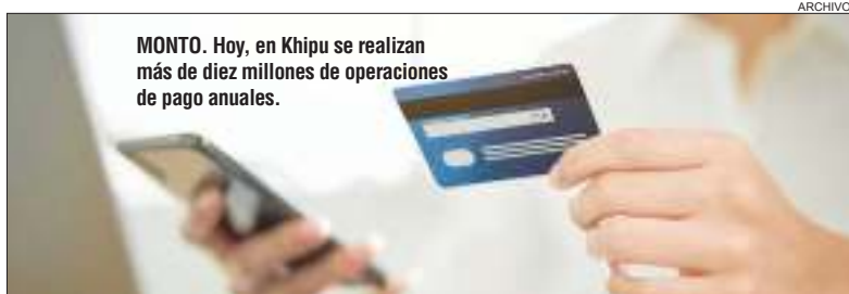
MONTO. Hoy, en Khipu se realizan más de diez millones de operaciones de pago anuales.

La firma Khipu cruzó la cordillera para instalarse por primera vez en Argentina con el plan de seguir con su crecimiento sostenido de entre 50% y 90% del último año