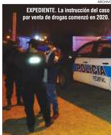
EXPEDIENTE. La instrucción del caso por venta de drogas comenzó en 2020.

Siguiendo el razonamiento de Frezzini, la Casación indicó que la sentencia en crisis no tuvo en cuenta los in-