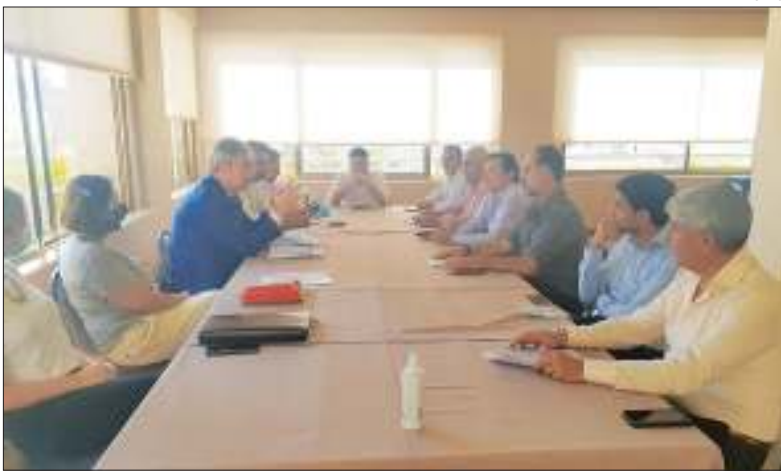
COMPROMISO. Representantes de cuatro cooperativas cordobesas presentaron un documento inédito para valorizar el trabajo que realizan.

El acta firmada es un compromiso ético que asumen para mejorar las condiciones de trabajo de los asociados. Está abierta la convocatoria a las demás que quieran sumarse a esta iniciativa