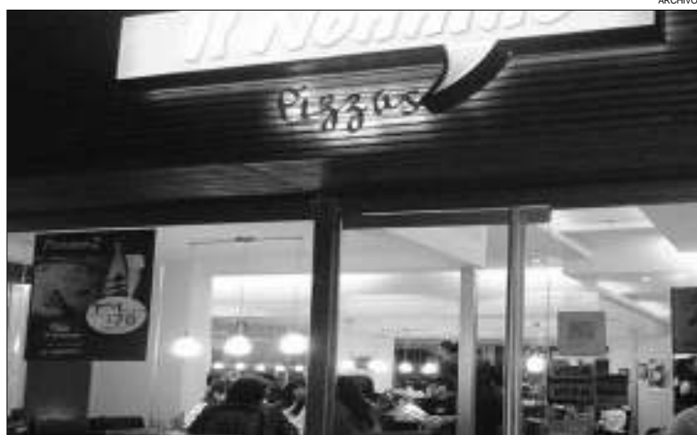
ESCENARIO. El local gastronómico -hoy cerrado definitivamente- donde trabajó la demandante.

El tribunal integrado por el vocal Tomás Sueldo, al analizar la indemnización especial artículo 182, LCT, indicó que resultaba procedente ese agravamiento indemnizatorio especial, por cuanto el despido sin causa dispuesto por el empleador resultó operativo a